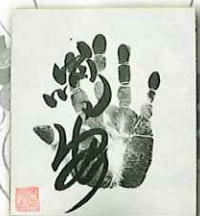
●力士直筆サイン例

▶▶▶プレイガイド先行予約発売◀◀◀ 11/18(土)～11/22(水)各プレイガイドにて先行発売開始!